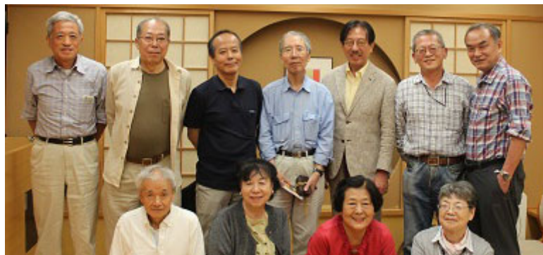
2018. 4. 29 クラス会にて